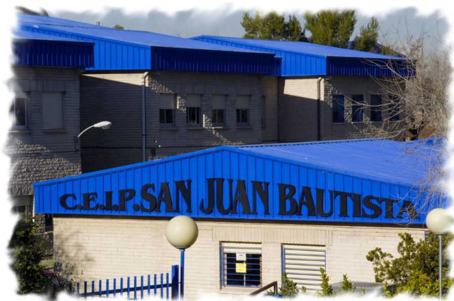
Imagen de las antiguas instalaciones del centro, destacando el marcado color azul de sus tejados.

El curso 2014- 2015, el CEIP San Juan Bautista inauguró nuevas instalaciones, con un nuevo y moderno edificio de dos plantas, y amplias pistas deportivas y de recreo. Unas instalaciones de vanguardia y referente actual del paradigma educativo de la Comunidad de Madrid.